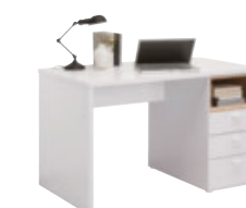
Schreibtisch 3 Schubkästen B/H/T: ca. 120 x 74 x 70 cm