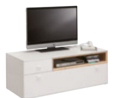
TV-Unterteil 1 Schubkasten, 1 Klappe B/H/T: ca. 129 x 48 x 50 cm