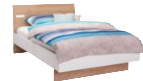
Bett Lgf. ca. 120 x 200 cm oder 140 x 200 cm, wahlweise mit Beleuchtung erhältlich