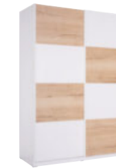
Schiebetürenschränk 2 Schiebetüren B/H/T: ca. 150 x 213 x 62 cm